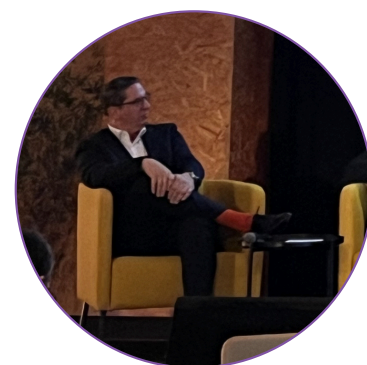
ALEXANDRE EPALLE DIRECTEUR GÉNÉRAL OFFICE CANTONAL GENEVOIS DE L'ÉCONOMIE ET DE L'INNOVATION

Le premier axe de la stratégie repose sur les conditions-cadre nécessaires pour le développement de l'industrie. L'objectif est ainsi de faciliter le quotidien des entrepreneurs de notre territoire avec un accès à des infrastructures de qualité: mobilité, formation, sécurité. La fiscalité est un autre pilier des conditions-cadre, d'autant plus dans le contexte de la réforme BEPS de l'OCDE qui instaure un taux d'imposition minimum de 15 % pour les multinationales réalisant plus de 750 millions d'euros de chiffre d'affaires. Compte tenu de cette concurrence internationale, le Canton de Genève doit donner aux entreprises l'envie de rester et de s'établir sur son territoire.