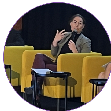
OLGA GIVERNET DÉPUTÉE DE L'AIN ASSEMBLÉE NATIONALE

Notre territoire possède des ressources stratégiques notamment en eau, en énergie et en matériaux. Il convient de s'interroger sur la manière dont nous pouvons gérer et structurer les flux de matériaux pour traverser la frontière de manière plus fluide avec moins d'entrave administrative. Ce sont aussi des travaux que nous devons mener entre politiques et avec l'ensemble des acteurs locaux.