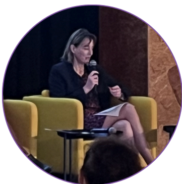
CÉLINE WEBER CONSEILLÈRE NATIONALE PARLEMENT FÉDÉRAL

La question du recyclage des matériaux est intéressante. Une vision d'ensemble des débouchés serait pertinente à l'échelle lémanique. Le recyclage du verre dans le Canton de Vaud se fait en Italie ce qui induit un impact environnemental. Ce qui manque ici, c'est l'ambition du recyclage au niveau européen, au niveau suisse et au niveau français. Comment améliorer la transformation et la valorisation des matériaux ? Les débouchés existent mais l'industrie du recyclage n'est pas assez développée dans une optique d'économie circulaire et non plus linéaire.