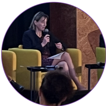
CÉLINE WEBER CONSEILLÈRE NATIONALE PARLEMENT FÉDÉRAL

En tant que présidente de la conférence romande pour la formation continue, j'aimerais tout d'abord insister sur la question de la formation. Un récent sondage démontrait que la pénurie de main d'œuvre était un sujet de préoccupation pour 40% seulement des entreprises. Dans les critères de recrutement, l'enjeu de la formation apparaissait après l'expérience. Il n'en reste pas moins que pour la région lémanique, la présence d'une offre de formation est structurante pour l'économie. Pour pallier le manque de main d'œuvre, il conviendrait également de développer les systèmes de micro-certification et de formation pratique. En ce sens, la formation duale en Suisse avec l'apprentissage permet de préparer des personnes de manière opérationnelle. Les investissements publics sont primordiaux pour soutenir le développement de la formation et in fine renforcer l'attractivité de toute notre région.